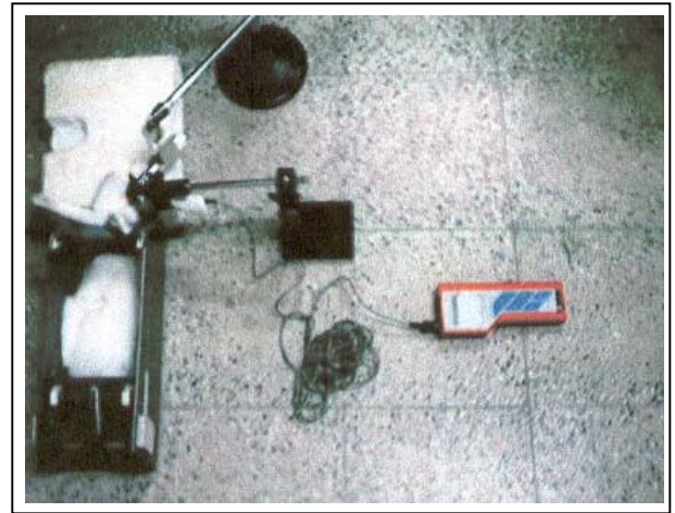
تصویر شماره ۱- شیوه نورسنجی، محل چشمه نور و لوکس‌متر در تصویر مشخص شده است.

تصویرهای سونوگرافیک نیز از طریق نرم افزار Movie Studio ثبت، ذخیره و قابل نمایش دادن شد. پس از پردازش تصویرها با استفاده از الگوریتم‌های آشکارسازی لبه (edge detection) در تصویرهای B-mode و ردیابی اکو (echo-tracking) در تصویرهای A-mode، میزان جابه‌جایی (میلی‌متر) و تغییر جابه‌جایی نسبی (استرین) محور چشم اندازه‌گیری شد و با توجه به تغییر استرس وارد شده (نیوتن بر متر مربع) و معادله (و)، مدول الاستیک (نیوتن بر متر مربع) در چشم مبتلا به کاتاراکت و در شرایط in vivo برآورد گردید. برای بررسی میزان اثر فعالیت فیبرهای زنولا، پاسخ رفلکس چشم در مقابل فشار خارجی، عدم جریان مایع زلالیه و غیره بر شاخص‌های الاستیک چشم ارزیابی شد و با نتایج گزارش شده در مطالعه سایر محققان که شاخص‌های صوتی - مکانیکی چشم کاتاراکته شده را به صورت تهاجمی اندازه‌گیری کرده بودند مورد مقایسه قرار گرفت. مطالعه به صورت in vitro نیز انجام شد که به این