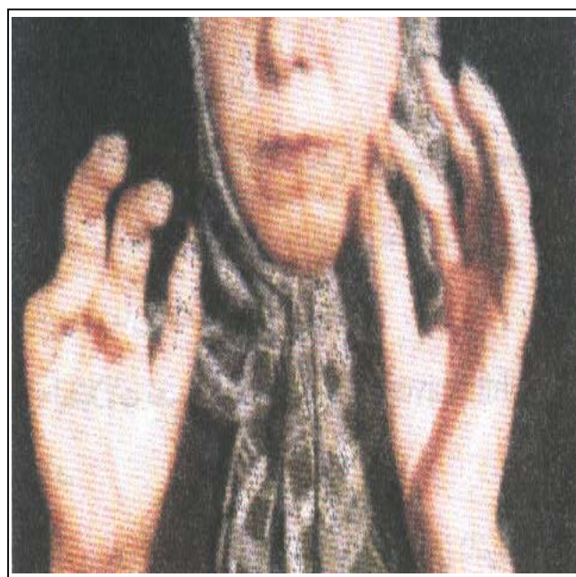
شکل ۱- الف: وضعیت انگشتان بیمار قبل از درمان با آلپروستادیل