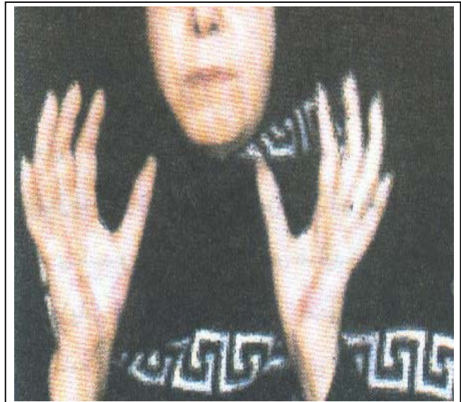
شکل ۲- الف: وضعیت انگشتان دست بیمار دو ماه بعد از درمان با آلپروستادیل