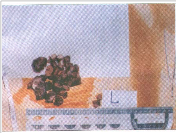
تصویر شماره ۲- نمای ماکروسکوپی توده گردن

در بالای کلاویکل در قاعده لترال گردن قابل مشاهده بود. انحراف تراشه به سمت راست و کاهش صداهای ریوی در قسمت فوقانی سمت چپ، در معاینه قفسه سینه وجود داشت.