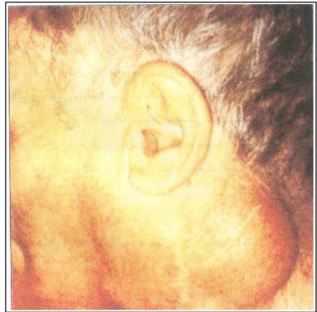
تصویر شماره ۱- پاراگانگلیوم کاروتید بادی در سمت چپ گردن

در رادیوگرافی قفسه سینه پهن شدن شدگی مدیاستن و انحراف تراشه به سمت راست مشاهده شد در نتیجه این برای بیمار سی‌تی‌اسکن قفسه سینه و شکم درخواست گردید.