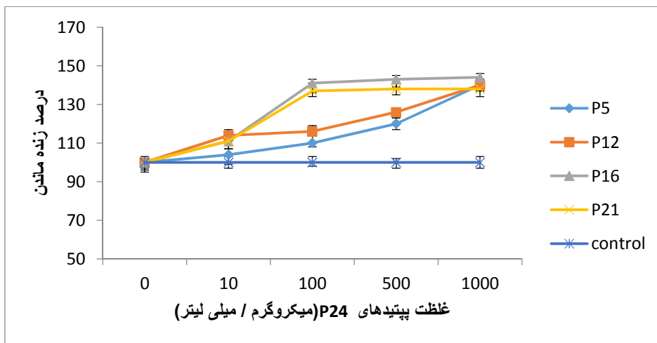
نمودار ۱- درصد بقای لئفوسیت‌ها در غلظت‌های مختلف پپتیدهای مثبت