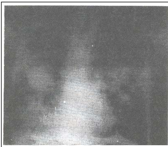
تصویر شماره ۱- عکس قفسه سینه قبل از ملانوپتزی

تنگی نفس، تشدید ویزینگ و سیانوز بود که با اقدامات درمانی این علائم برطرف گردید. از بیمار گرافی قفسه سینه بعمل آمد و همانطور که در تصویر شماره ۲ نشان داده شده است در ندول بزرگ ریه راست بیمار در مقایسه با گرافی قبل از ملانوپتزی (تصویر شماره ۱) حفره بزرگی تشکیل گردیده بود. از بیمار برونکوسکوپی بعمل آمد و ترشحات سیاهرنگ در راههای هوایی وی ملاحظه گردید. جهت رد سایر علل تشکیل حفره در ندول PMF، نمونه ترشحات بیمار از نظر BK، سیتولوژی و عفونتهای قارچی بررسی شد که جواب همه موارد منفی بود، لذا جهت بیمار تشخیص ملانوپتزی حجیم خودبخودی مطرح شد.