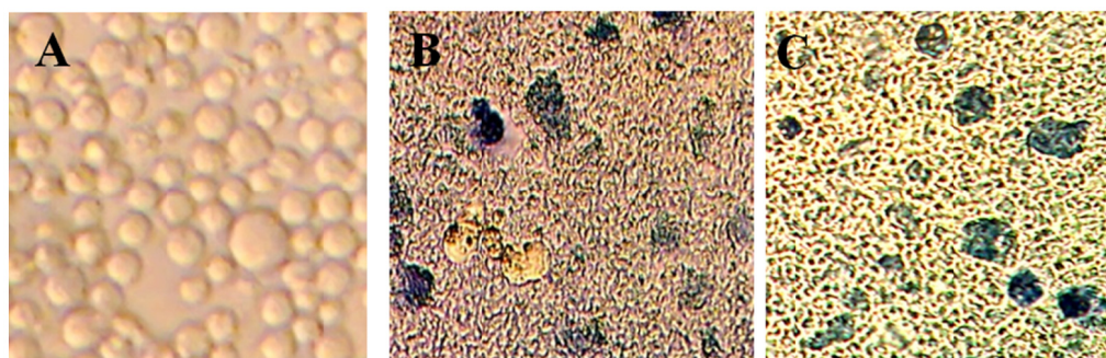
شکل ۱- تغییرات ریخت‌شناسی سلول‌های K562 تیمار شده با لاکتوباسیلوس‌های کازویی و پاراکازویی کشته شده توسط حرارت با استفاده از میکروسکوپ نوری (بزرگنمایی ۴۰X). A: سلول‌های کنترل، B: سلول‌های تیمار شده با ل. کازویی کشته شده با حرارت، C: سلول‌های تیمار شده با ل. پاراکازویی کشته شده با حرارت.

* داده‌ها به صورت Mean \pm Standard Deviation بیان شدند. *حروف غیر یکسان در هر ستون نشان‌دهنده وجود اختلاف آماری معنی‌دار در سطح P < 0.05 می‌باشد.