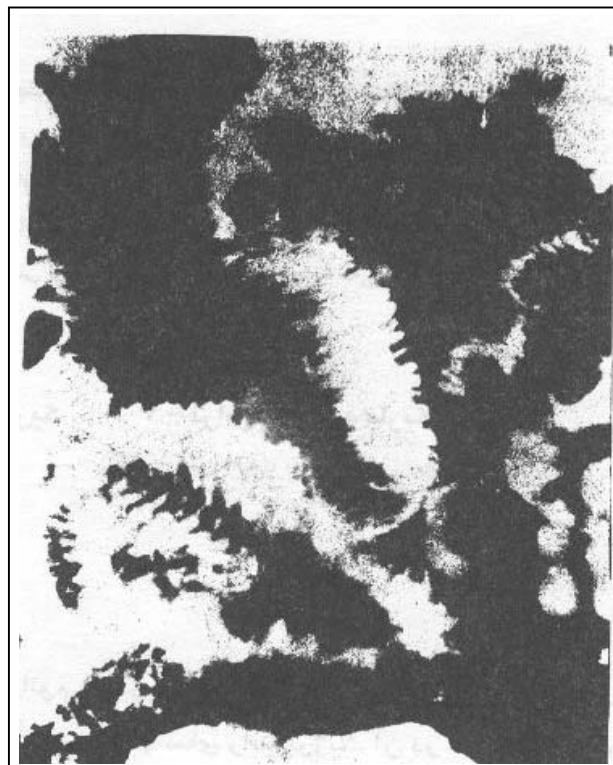
تصویر شماره ۱- لنفانژیوم. ضایعات فضاگیر متعدد کوچک داخل مجرای و داخل جدار با حدود مشخص دیده می‌شود.

که همه آنها طبیعی گزارش شد. در آخرین مراجعه، جهت بیمار آزمایش ترانزیت روده باریک (با استفاده از باریم) درخواست گردید. در کلیشه‌های تهیه شده، ضایعات فضاگیر متعدد با ابعاد کوچک و همچنین حدود مشخص، هویدا گردید (تصاویر شماره ۱ و ۲).