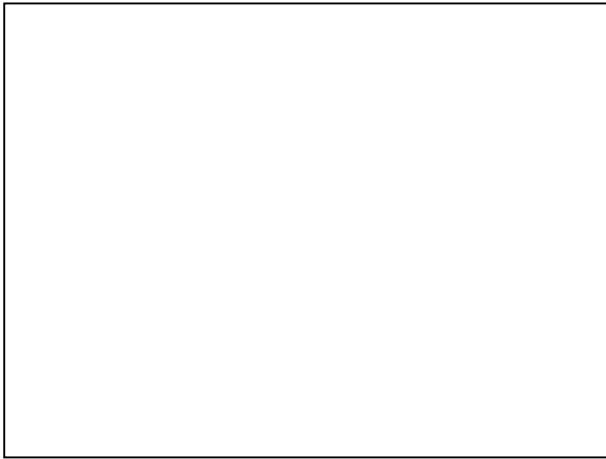
تصویر شماره ۵- آنژیوگرافی اندام تحتانی اثر توده بر شریان پوپلیته را نشان می‌دهد.

آنژیوگرافی اندام تحتانی چپ جابجایی خلفی شریان پوپلیته توسط توده‌ای در قسمت خلفی فضای پوپلیته را نشان داد. در قسمت مرکزی یک توده پرعروق و بدون تهاجم به عروق مشاهده شد (تصویر شماره ۵). برای بیمار بیوپسی تشخیصی انجام شد که گزارش آسیب‌شناسی از نمونه بیوپسی، کیست سینوویال با تغییرات کندروماتوزیس بود. در نهایت بیمار تحت آرتروتومی قرار گرفت و توده‌ای با قطر حدود ۱۰ سانتی‌متر به صورت منفرد و متصل به کپسول و سینوویوم بدون وجود شواهدی به نفع تهاجم از فضای مفصلی خارج گردید (تصویر شماره ۶). در بررسی آسیب‌شناسی توده، تنها سینوویال کندروماتوزیس گزارش گردید (تصویر شماره ۷).