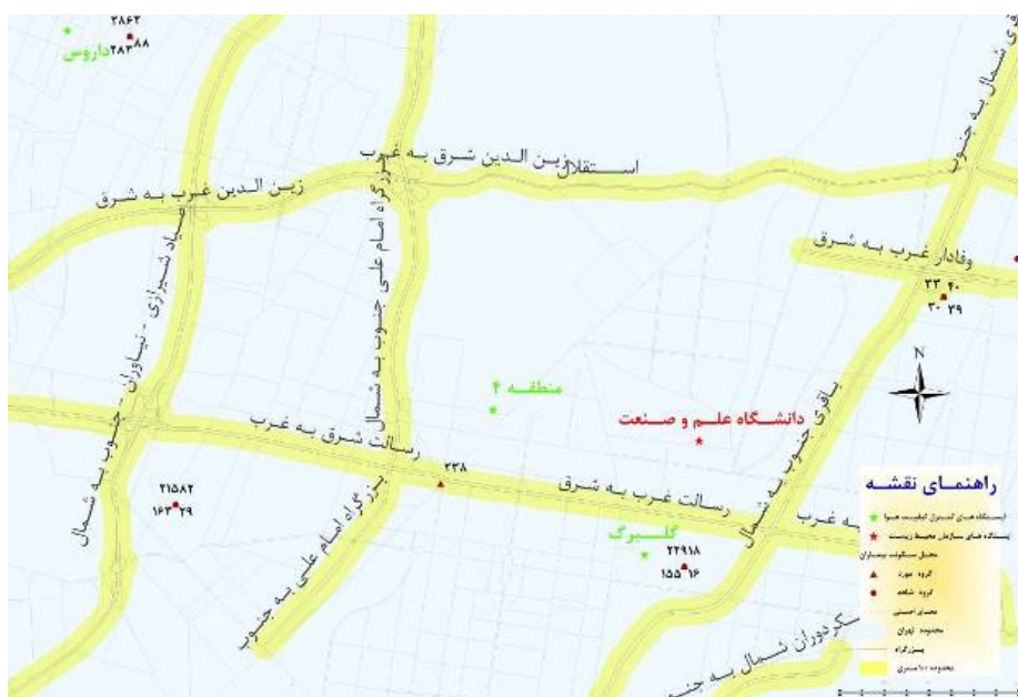
شکل ۲. نمونه ای از تحلیل بافر جهت بررسی نمونه هایی که در فاصله ۵۰ متری از طرفین بزرگراه های اصلی قرار گرفته اند

(۲۳، ۲۲، ۱۰)، وزن کم هنگام تولد (۲۴-۲۶ و ۸)، پره اکلامپسی (۲۸ و ۲۷)، نقایص مادرزادی (۲۹ و ۱۱، ۱۲) و ناباروری (۳۰) انجام شده است؛ در حالی که در مورد تاثیر آلودگی هوا بر سقط جنین پژوهش های اندکی وجود دارد. موهوریک در مطالعه ای که بر تاثیر دی اکسید گوگرد محیط بر پیامدهای بارداری انجام داد مشخص نمود که ارتباطی بین افزایش میانگین متهموگلوبین مادر و غلظت دی اکسید گوگرد در