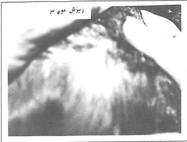
ریزش موی سر

برای بیماری که با کاکل سفید ( white forelock ) مادرزادی