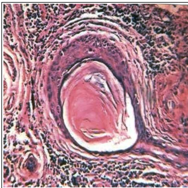
تصویر شماره ۲- کیست‌های حاوی تجمعات کراتین

در این مقاله یک مورد تیبیک از این ضایعه معرفی شده و مقالاتی در این زمینه مرور می‌گردد.