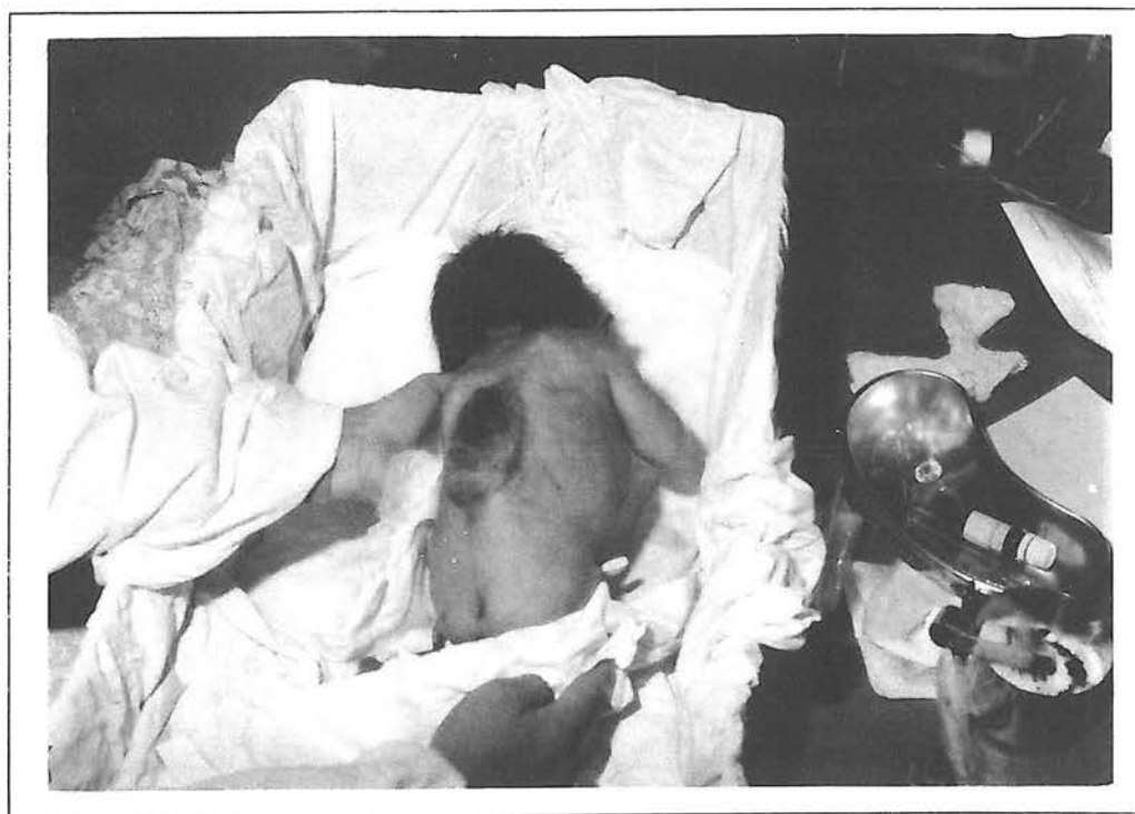
شکل ۲- نوزاد ۲ روزه مبتلا به مننگومیلوسل - مرکز آموزشی درمانی شهید اکبر آبادی

آقای Smotheralls ختم حاملگی را راه پیش‌گیری و درمان قطعی نمی‌داند، چون ختم حاملگی در خیلی از کشورها غیر قانونی و حتی اگر تشخیص صددرصد باشد پسندیده نیست و نیز بسیاری از والدین نمی‌توانند این واقعیت را بپذیرند چون فرزند خود را دوست دارند (۹) و نیز عده‌ای از محققین معتقدند با این روش درمانی پیشگیرانه میزان NTDs را با