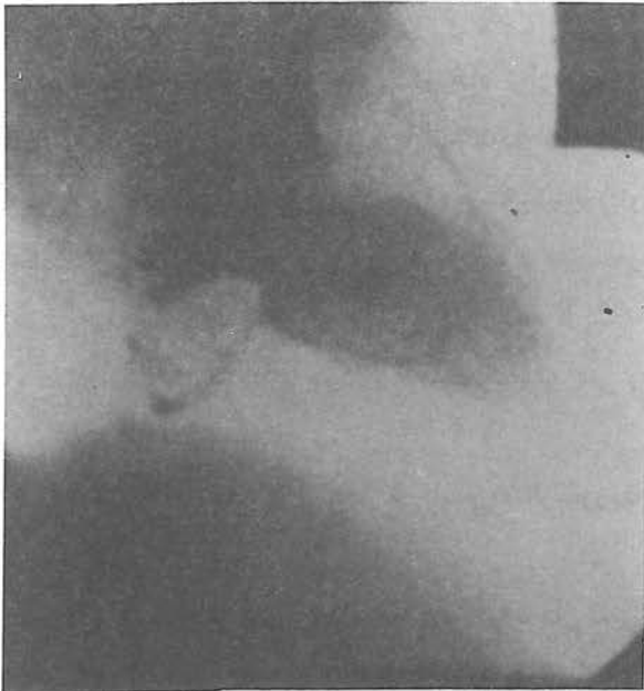
شکل شماره ۱: نمای آنژیوگرافیک بطن چپ بیمار مبتلا به پرولاپس دریچه میترال

علت همزمانی اختلالات استخوانی قفسه سینه و شیوع بالای پرولاپس دریچه میترال بطور وضوح روشن نیست ولی پیشنهاد شده که پرولاپس میترال و Pectus excavatum اسکولیوز تظاهراتی از اشکال خفیف سندرم مارفان است. توصیف جنین شناسی آن همزمانی تکامل دریچه میترال و غضروفی و استخوانی شدن ستون مهره‌ها و قفسه سینه است و لذا اختلال در آهنگ رشد در این مرحله ممکنست همراه با اختلال در دریچه میترال، قفسه سینه را نیز مبتلا کند.