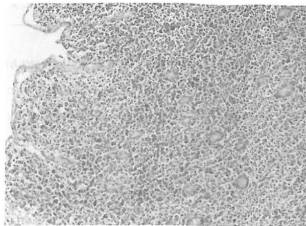
فتوگرافی شماره ۱

فتوگرافی شماره ۱ و ۲- تصاویر آسیب شناسی نمونه برداشته شده