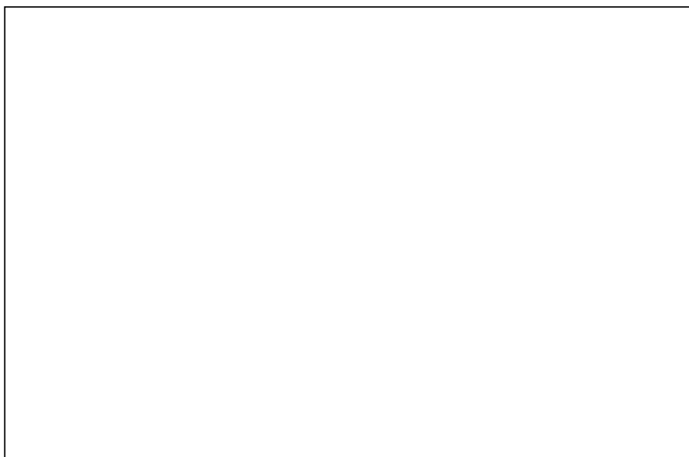
تصویر شماره ۱- در رادیوگرافی نواحی خوردگی استخوان در بند دیستال انگشت چهارم دیده می‌شود.

دو فاز رشد در تومور دیده می‌شود که عبارتند از: ۱- فاز اولیه(initial phase) که در بچه‌ها بیشتر دیده می‌شود و در آن رشد تومور به صورت منتشر است و ۲- فاز دیررس که به صورت فشرده و ندولار است.