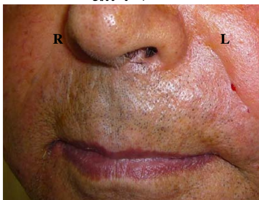
ب. پس از تزریق