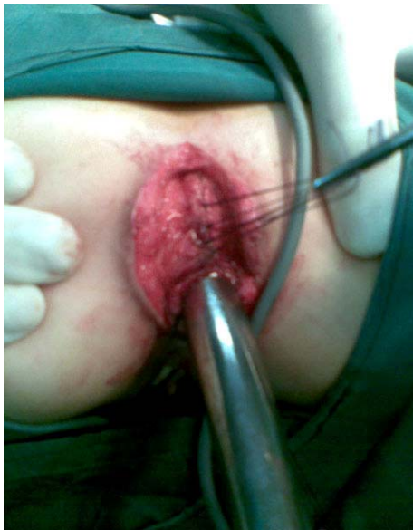
تصویر شماره ۵- جابجایی ناقص رکتوم به علت نقص اسفنکتر مقعد پس از ترمیم

حلقوی در ساعت ۹ دیده شد. معمولاً آخرین بررسی بیماران در زیر بیهوشی با Muscle stimulator (تصویر شماره ۵) بوده و در ۲ مورد اسفنکتر مقعد، خارج از دهانه رکتوم و در کنار آن (Complete mislocation) قرار داشت (تصویر شماره ۳). نقص حلقوی اسفنکتر مقعد در ۵ مورد در ساعت ۱۲ (تصویر شماره ۴)، در ۲ بیمار در ساعت ۱، ۶ مورد در ساعت ۳ و در یک بیمار در ساعت ۹ مشاهده گردید (جدول شماره ۱).