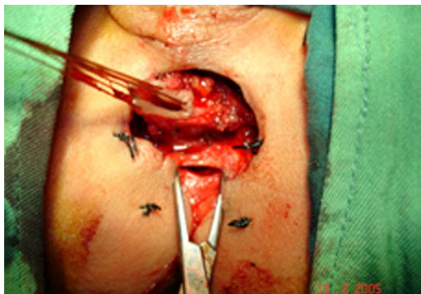
تصویر شماره ۳- جابجایی کامل رکتوم