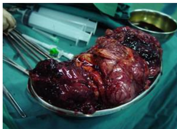
اشکال شماره ۲ و ۳- ظاهر تومور پس از باز کردن شکم و پس از رزکسیون