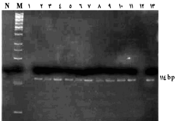
شکل شماره ۲- تایید PCR ژن طبیعی FLT3 (اگزون ۲۰) که جهش نقطه‌ای D835 در این ناحیه اتفاق می‌افتد (مرحله قبل از اضافه کردن آنزیم) M = Marker N = Negative control

از ۱۰۱ بیمار مبتلا به AML، میزان ۶٪ جهش نقطه‌ای (D835) را داشتند که فقط در بیماران M2 و M3 و M5 این جهش مشاهده شد. باندهای موجود در شکل شماره ۲، محصولات PCR اگزون ۲۰ (محل وقوع D835) را قبل از مواجهه با آنزیم محدودالایتر ECORV در تعدادی از این افراد را نشان می‌دهد